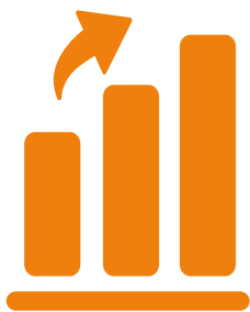
Marknadsetablering: 3 år

Från kommersiell lansering är Bolagets bedömning att det tar cirka tre år för marknadsetablering och för att penetrera marknaden till 10%, vilket är Bolagets målsättning. Utvecklingen av banbrytande medicinteknik är kostnads- och tidskrävande på grund av de regulatoriska processerna, men när produkten väl når marknaden beräknas Bolaget få lönsamhet snabbt.